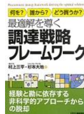
「調達戦略フレームワーク」 村上三平・杉本大地 (日刊工業新聞社)

理学博士として産官学共同プロジェクトに参加後、弊社に参画。製造業を始めとする数多くのクライアント企業における調達戦略立案、コスト削減プロジェクトを指揮